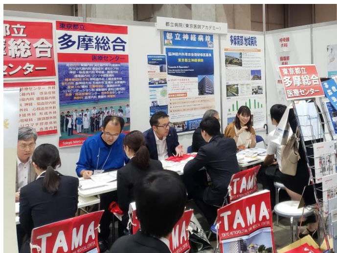
医師アカデミーブースの様子