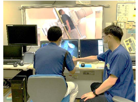
ポジショニング実習

メールの返信がない場合・お急ぎの場合には、お電話によるご連絡をお願いいたします。